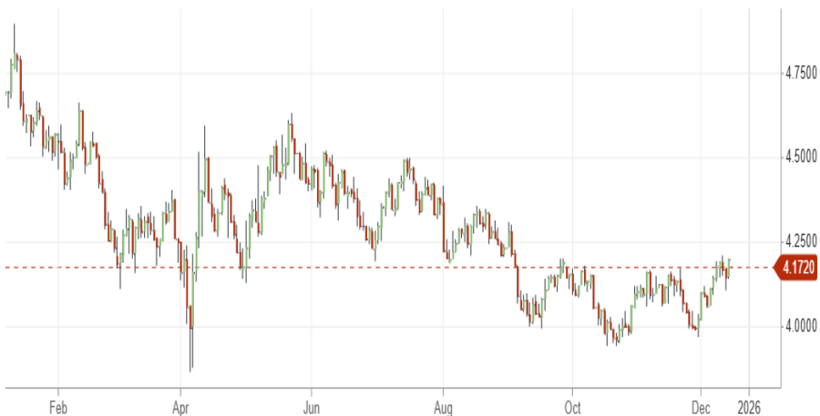
美國 10 年公債利率