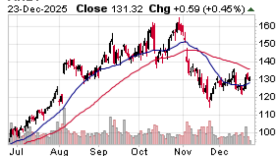
ANET Arista Networks NYSE