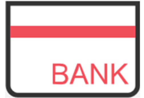
銀行存摺 (出金限1個 入金最多10個)