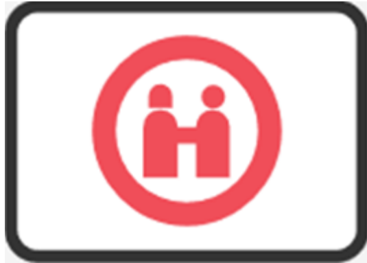
第二證件 (線上限健保卡或駕照)